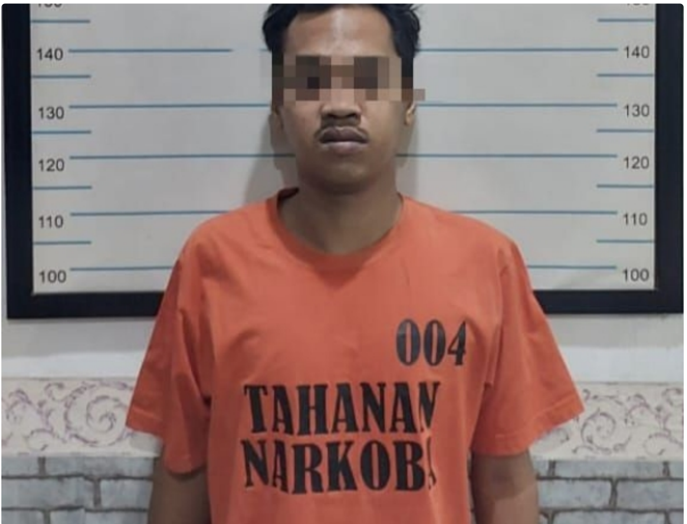
Sat Resnarkoba Polres Hulu Sungai Tengah Kembali Mengamankan Tersangka Penyalahgunaan Narkotika Jenis Sabu

BARABAI-Polres Hulu Sungai Tengah Polda Kalimantan Selatan- Satuan Resnarkoba Polres Hulu Sungai Tengah kembali berhasil mengamankan (TSK) ,